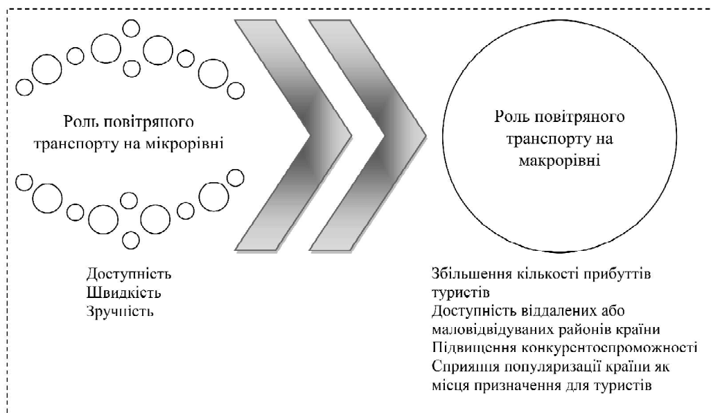
Рис. 2. Узагальнення ролі повітряного транспорту в туристичній діяльності на макро та мікро рівнях

Добре організоване повітряне сполучення може призвести до збільшення доходів для індустрії ту-