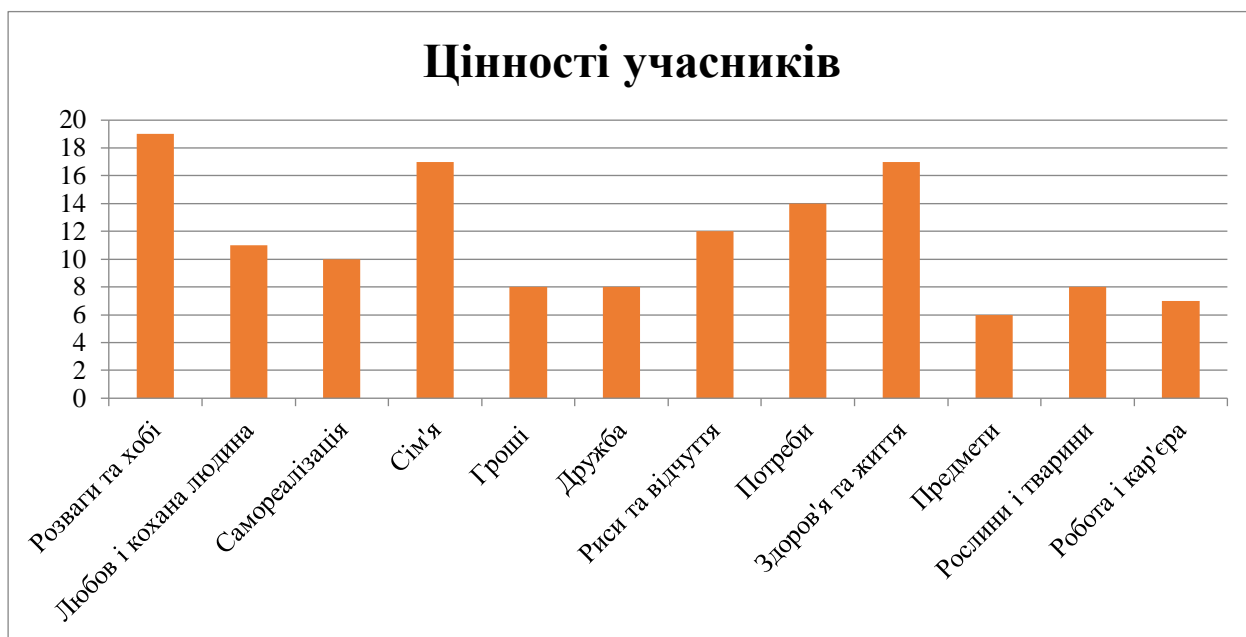
Діаграма 3. Цінності учасників

Проте, в нас є деякі вагання щодо інтерпретації результатів, адже все зводиться лише до номерного ряду кольору за Люшером. Тим самим, відкидається вплив асоціативного фактора, а саме відчуття та інтерпретаційне значення кольору.