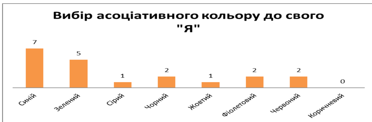
Діаграма 2. Вибір асоціативного кольору до свого «Я»

Найчастішим кольором для асоціації із самим собою було обрано синій, на другому місці опинився зелений.