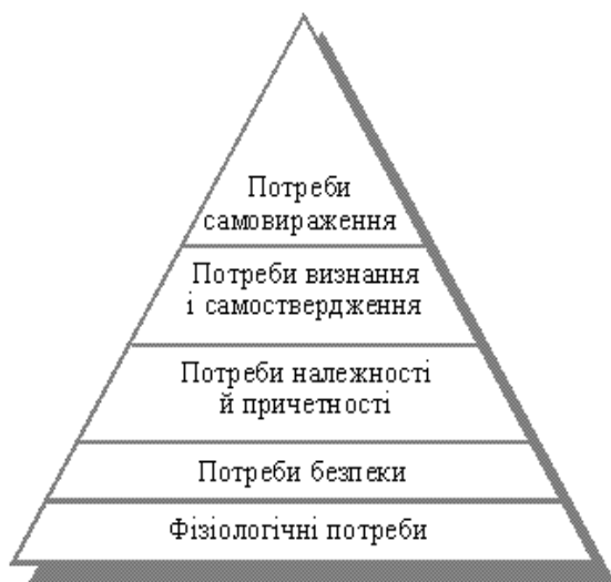
Рис. 6. Ієрархія потреб за Маслоу

З огляду на означені вище методологічні принципи можна вважати прийнятною таку систему потреб, яка складається з елементів, що відповідають основним сферам людської діяльності. Це потреби економічні, соціальні, політичні і духовно-культурні. Кожен елемент цієї системи включає власну підсистему потреб. Скажімо, духовно-культурні потреби включають національні потреби, потреби культурні, релігійні і т.ін.