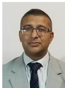
Біджай КАНДЕЛ © PhD (менеджмент) (Університет Катманду, Південнотихоокеанський університет, Велика Британія)