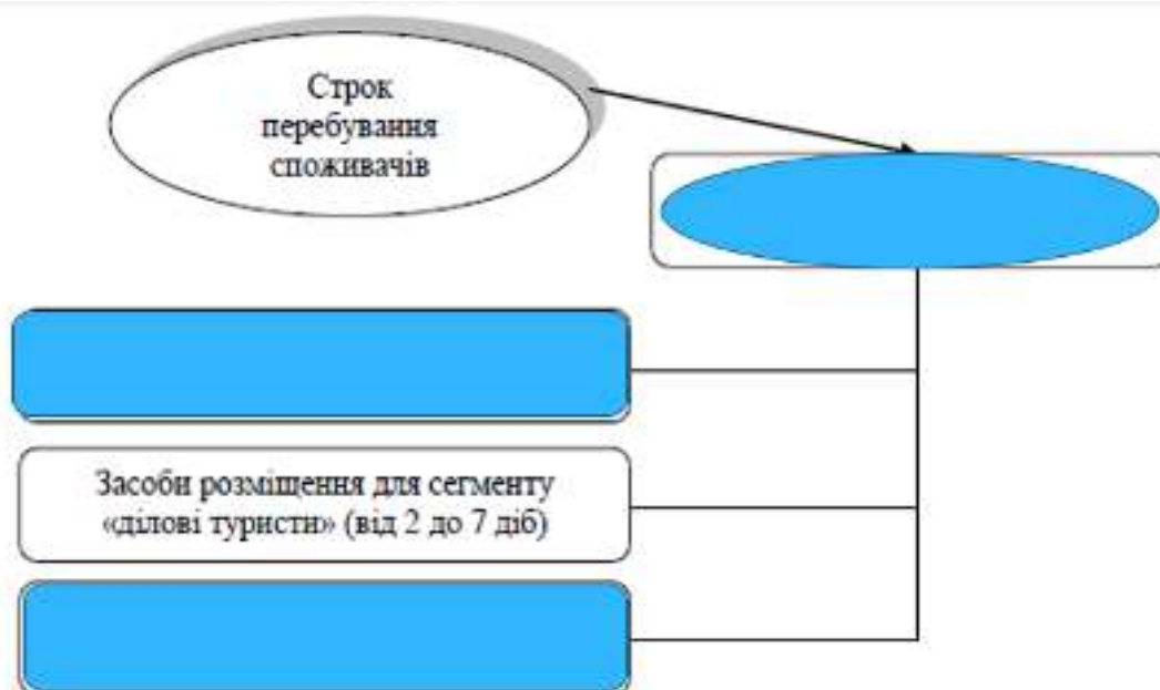
Рис. 3.2. Характеристика фактора «Строк перебування споживачів у засобах