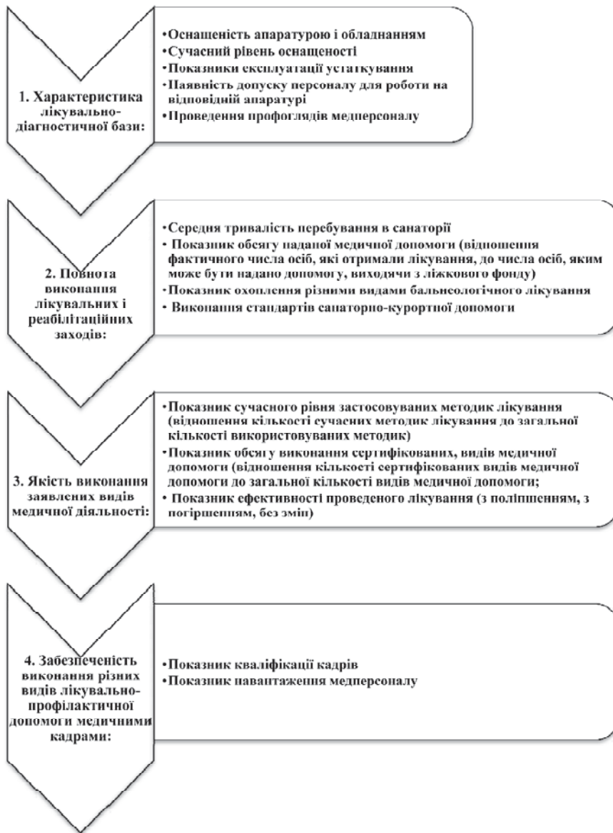
Рис. 2. Система показників рекреаційної діяльності санаторно-курортного підприємства